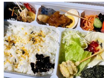
お弁当（例）島の食材たっぷり当！