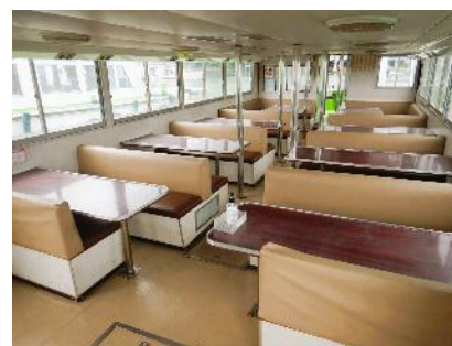
チャーター船内（例）