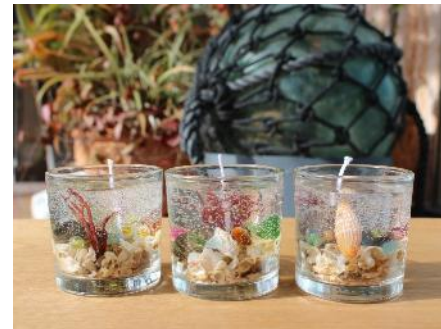
ジェルキャンドル作り