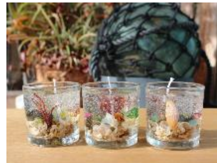
ジェルキャンドル作り