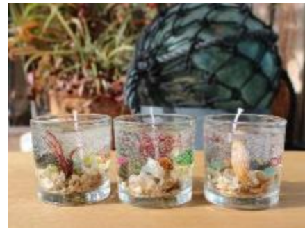
ジェルキャンドル作り