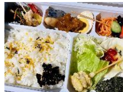
お弁当（例）島の食材たっぷり当！