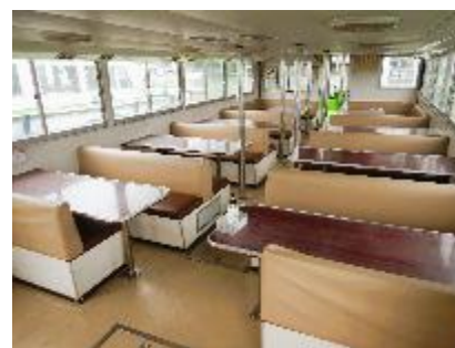
チャーター船内（例）